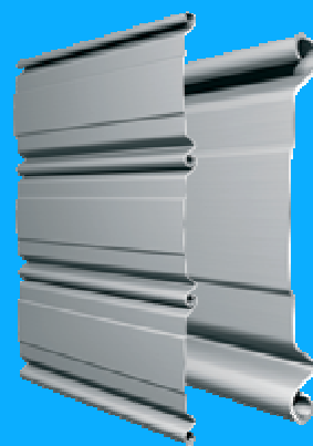
Τομή ίσου προφίλ

Το ρολό μπορεί να λειτουργεί και ηλεκτροκίνητα. Γίνεται χρήση μονοφασικού κινητήρα GAPOSA Ιταλίας, για το οποίο είμαστε εξουσιοδοτημένοι αντιπρόσωποι, με 2 χρόνια εργοστασιακή εγγύηση και η λειτουργία γίνεται με τηλεχειρισμό ή μπουτόν ή άλλου είδους access control. Σε περίπτωση διακοπής ρεύματος γίνεται χρήση του μεταλλικού απασφαλιστή που βρίσκεται εξωτερικά του χώρου ή αν υπάρχει δεύτερη είσοδος στον χώρο από εσωτερικό απασφαλιστή τύπου χειρολαβής.