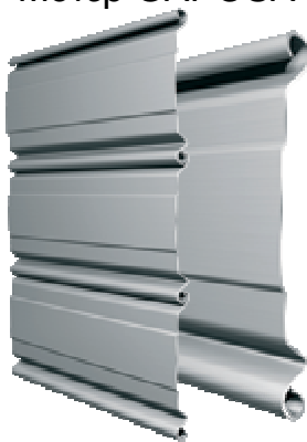
Τομή ίσιου προφίλ