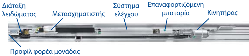
Σύστημα κύλισης αυτόματου καθαρισμού